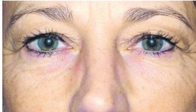
Gealterte und schwere Oberlider, medizinische Indikation bei einer 58-jährigen Frau.