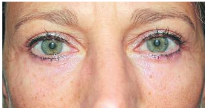
4,5 Monate nach der Oberlidstraffung ist der Blick offen und frei, die Lider sind entlastet. Die Unterlider wurden in diesem Fall mit operiert, allerdings mit nicht anerkannter medizinischer Indikation. Die Augenpartie wirkt insgesamt deutlich verjüngt. Der dunkle Augenring ist verschwunden.

bulant in örtlicher Betäubung. Manche sind beunruhigt nach dem Motto „Hilfe, da geht einer an meine Augen!“ Aber so schlimm ist es nicht. Wir haben sehr gute Mittel, die Besorgten unter unseren Patienten in ein angenehmes „Ruhekissen“ zu betten, so dass Ängste gar nicht mehr wahrgenommen werden. In unserer Praxis ist es uns besonders wichtig, auf Ängste und Bedenken unserer Patienten so gut es geht und mit viel Geduld einzugehen. Aber ohne Schnitt geht es trotzdem nicht – wir machen es nur viel leichter.